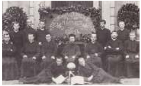
So präsentierte sich die Abiturientia 1913 mit ihren Lehrern dem Photographen.