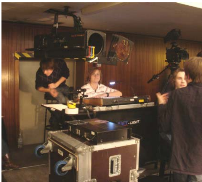
Das Technik-Team war für den guten Ton verantwortlich.

Auch das diesjährige Herbstkonzert, das der Förderverein zusammen mit der Musikfachschaft am 14. November ausrichtete, war wieder ein voller Erfolg. Es hat sich mittlerweile herumgesprochen, dass die Auftritte der diversen Chöre, der Jazzband und des Schulorchesters ein bemerkenswert hohes musikalisches Niveau haben. Die zahlreichen Besucher jedenfalls geizten nicht mit Beifall. An dieser Stelle sei speziell die Aufführung der Musikklasse der Jahrgangsstufe 5 hervorgehoben, die mit ihren witzigen Beiträgen und originellen Kostümen besonders gut ankam. Die Organisatoren freuten sich natürlich auch, dass nach dem Konzert noch viele Gäste die Möglichkeit nutzten, um miteinander bei Bier und Schnittchen ins Gespräch zu kommen. Nachfolgend sind vier Szenen des Abends im Bild festgehalten: