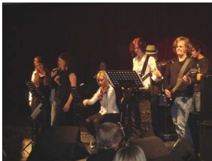
Die Jazz-Band stimmte mit beschwingten Rhythmen in den Konzertabend ein und sorgte ebenso für einen schwungvollen Ausklang.