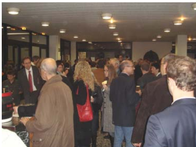
Nach dem Konzert gab es im Foyer bei einem Kölsch und Schnittchen noch einiges zu bereden.